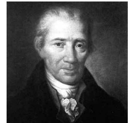
Johann Georg Albrechtsberger. Porträt von Leopold Kupelwieser

hunderts war die Posaune sehr populär und in Wien und an den umgebenden kleineren Höfen und Klöstern lebhaft im Einsatz. Der solistische Einsatz des Instruments war hingegen stark auf geistliche Musik beschränkt. Einzelheiten zu den Umständen der Erstaufführung des Konzerts sind nicht überliefert. Trotz der Popularität des Instruments innerhalb der Kirchenmusik ist Albrechtsbergers Komposition nur eines von vier existierenden Konzerten, die für die Posaune im 18. Jahrhundert geschrieben wurden. Alle diese Kompositionen sind für Altposaune gesetzt, die damals bevorzugt eingesetzt wurde. Albrechtsbergers Concerto ist seine heute am häufigsten aufgeführte Komposition und ein Hauptwerk innerhalb des Posaunenrepertoires. „Das Konzert strahlt das Flair vitaler Genialität aus. Durch alle Sätze des Werks hindurch – Allegro moderato, Andante, Allegro moderato – gelingt Albrechtsberger eine vornehme Balance zwischen seinem eigenen, strengen Kontrapunkt und dem glitzernden, neuen galanten Stil“ (Paul Serotsky).