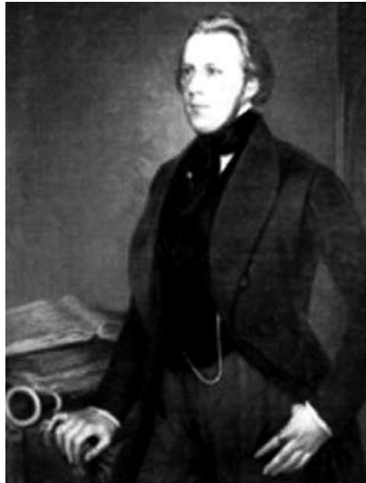
Heinrich Joseph Baermann

Carl Maria von Weber schrieb in seinen beiden Klarinettenkonzerten natürlich Musik, die den Virtuosen Baermann wirkungsvoll in Szene setzte. Doch beide Konzerte sind mehr als virtuose Glanzstücke. Sie leben von neuen