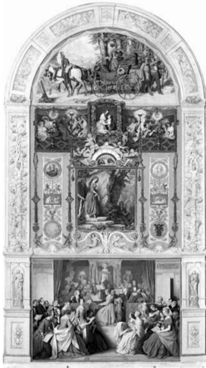
Moritz von Schwind, Die Symphonie (1852), Abbild des menschlichen Lebens, mit Beethoven-Büste im unteren Bildteil

Mozart oder Haydn unterschätzt. Zwar orientierte sich Beethoven zweifellos an Haydns damals aktuellen „Londoner Sinfonien“ sowie an Mozarts „Linzer Sinfonie“ bzw. an der „Jupiter-Sinfonie“, aber in vielen Aspekten ist das Werk weit mehr als eine Vorbildern verpflichtete Stilübung. Schon der erste Akkord der langsamen Einleitung mit einer Dissonanz ist ein provokativer und kühner Gedanke.