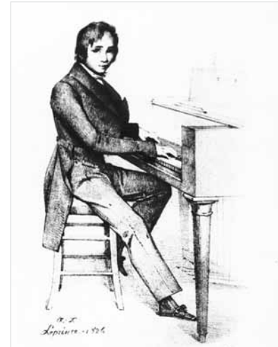
Franz Liszt am Klavier, 1824

König dieses Ortes, gewaltiger Geist, der du über jeden Sterblichen herrschest! In meinem Hochmut bestraft, neige ich mich nun vor deinen Altären. Amor! In dieser äußersten Gefahr, komme und unterstütze Don Sanche! Wenn du willst, dass ich liebe, rette ihn, denn einen anderen kann ich nicht lieben! Mein gnadenloser Gleichmut,