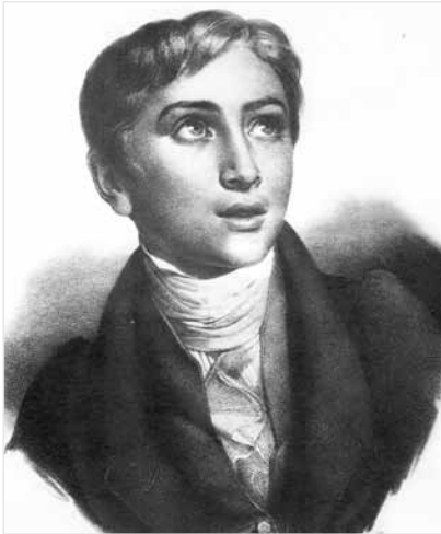
Franz Liszt um 1825

DON SANCHE, ALIDOR Eifersüchtige Leidenschaft usw.