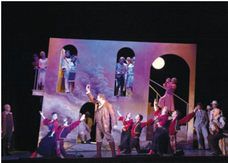
Solisten, Opernchor und Ballettkompanie

für einen schönen Mann von edler Herkunft“. Die weit ausladende Melodie, unterstrichen von Solovioline und summendem Chor, sprengt fast den Rahmen der Operette und legt zugleich ihren eigentlichen Kern frei: das Märchen, in dem das Wünschen noch geholfen hat. Als wäre für einen kurzen Augenblick die Realität einer den eigenen Wünschen längst entfremdeten Menschheit aufgehoben. In solchen Momenten winkt jedem das Glück – auch den zwei Königskindern, die, im Märchen füreinander bestimmt, in der Operette nicht zusammenkommen können. Kálmán hat für diese Utopie Töne gefunden, die nicht von dieser Operettenwelt sind, und deren sich, wie schon die „Neue Freie Presse“ bemerkte, „auch ein Opernkomponist nicht zu schämen hätte.“