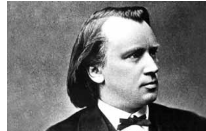
Johannes Brahms, ca. 1853

Gleichfalls schon zu Beginn des ersten Satzes wird die bereits angesprochene thematische Verwandtschaft mit dem Violinkonzert hörbar: ganz ähnliches Durchwandern des D-Dur-Dreiklangs, tiefe Streicher und Hörner, wiegender 3/4-Takt. Auch die Seitengedanken – der von den Ersten Geigen über Achtelbewegung vorgestellte Melodiebogen und die punktierte Gestik des folgenden Aufbruchs – erinnern an das Schwesterwerk. Lediglich das in Terzparallelen sich wiegende zweite Hauptthema in fis-Moll steht für sich. Autonom erscheint auch der zweite Satz, das Adagio in H-Dur; zum einen, weil sich hier das Kernmotiv im besten Falle an Floskeln und in Begleitstimmen festmachen lässt, zum andern, weil seine Themen schwer zu fassen sind. Die auf „entwickelnde Variation“ gerichteten Erwartungen werden insofern enttäuscht, als die melodischen Verläufe nachgerade als wuchernder Wildwuchs erscheinen. Schönberg hat hierfür den Terminus „ musikalische Prosa “ gefunden, womit denn diesem in 4/4- und 12/8-Metren gebetteten Wurzelwerk durchaus näher zu kommen ist. Unproblematischer dann die beiden folgenden Sätze – das zwischen behäbigem Menuett und